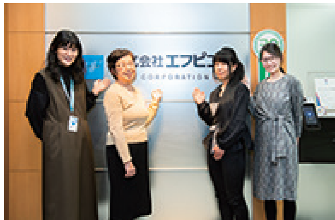
西村常務取締役と総務人事部の皆さん

2010年からは、社員同士のコミュニケーションを図るため、フロアホッケー活動をおこなっています。全国の拠点でエフピコグループの社員約600名（うち障がいのある社員200名、2021年7月時点）がアスリートとして活躍しており、全日本フロアホッケー連盟の全日本競技大会（東京）、西日本競技大会（福山）ではメインスポンサーに