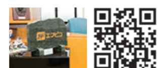
株式会社エフピコ https://www.fpc.jp

なっています。社員は大会の運営ボランティアとしても参加しています。 この活動は、2018年より、東京都スポーツ推進企業（東京都）、スポーツエールカンパニー（スポーツ庁）にも認定されています。「障がいの有無に関係なく、誰もが参加し交流し合うフロアホッケー活動を通して、違いを認めて尊重しあうインクルージョン社会へとつなげていきたい」との思いで活動を推進しています。