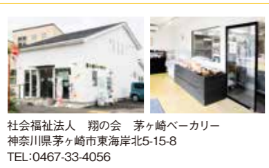
社会福祉法人 翔の会 茅ヶ崎ベーカリー 神奈川県茅ヶ崎市東海岸北5-15-8 TEL:0467-33-4056