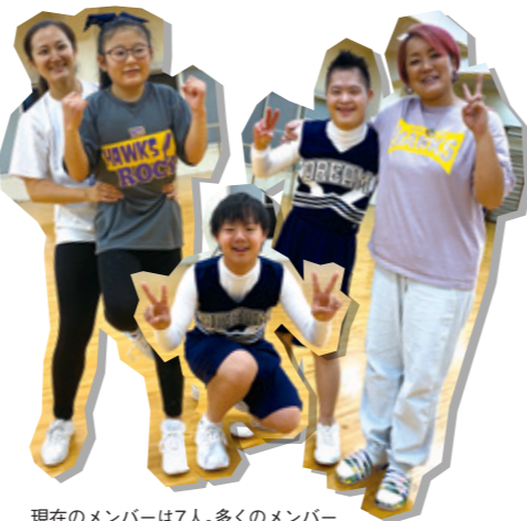
現在のメンバーは7人。多くのメンバーは設立当初から継続している。

以前とある大会でアメリカのダウン症のメンバーだけのチームによるパフォーマンスを見たことが、Dream Teamを作りたいと思ったきっかけです。彼らの