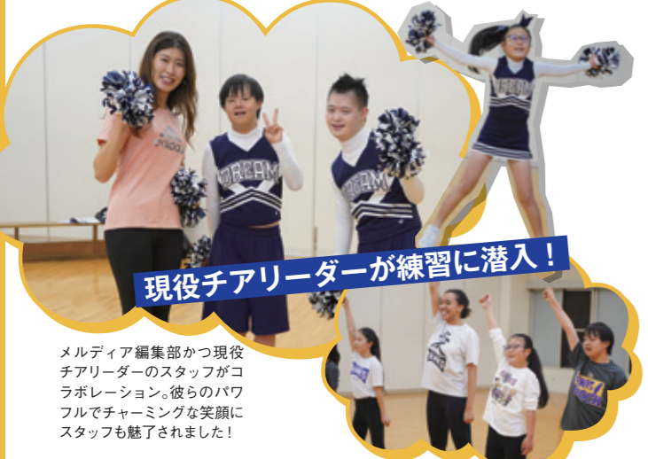
現役チアリーダーが練習に潜入!