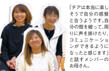
「チアは本当に楽しそう自分の感覚と合うようです。自周り声掛けたり、コミュニケーションができた感じが」と話すメンバーのお母さん。

本人たちにはもちろんのことですが、保護者の方にも、チアを一つのツールとして活用してほしいと思っています。色々なところで友達ができれば保護者同士も繋がりができます。色々な人と会って話をするのもいいです。お子さんのチャンスを広げる機会にもなると思いますし、学校からの情報だけでなく様々なところからの情報で楽しんで生活をしてほしい。世界中に友達を作るツールとしてチアダンスを使ってみてほしいです。