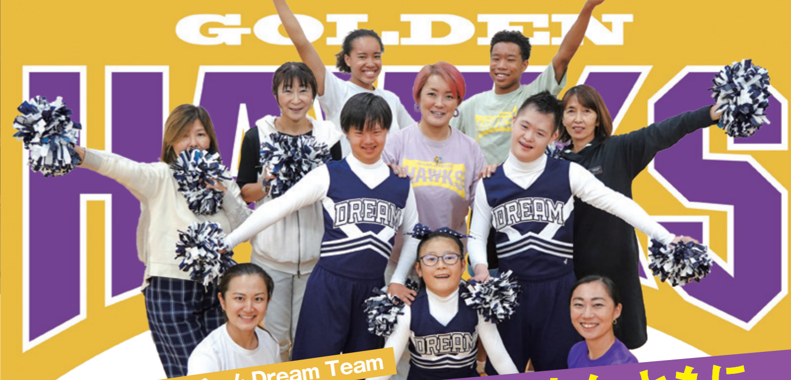
チアダンスチーム Dream Team